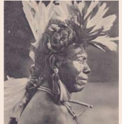
Indio Chamacoco, «Apuléi Préta», Puerto 14 de Mayo. Colección Boggiani, publ. por Dr. R. Lehmann Nitsche, N° 47 2047 Editor R. Rosauer, Rivadavia 571, Buenos Aires.

A principios del siglo XX, grandes centros de investigación se interesan en el Chaco, región que continúa atrayendo a los europeos. No todos emplean por igual la cámara fotográfica como herramienta de tra-