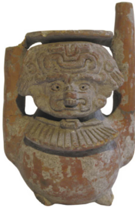
URNA con representación antropro-zoomorfa Cerámica 18 x 12 x 10 cm Cultura Zapoteca, Valle de Oaxaca 500 – 900 d.C. Colección particular

Como introducción a la muestra de piezas de las distintas culturas “mexicanas” provenientes de colecciones públicas y privadas de Uruguay, reunimos una amplia información acerca de los vínculos que se establecieron con respecto a esta temática entre nuestro país y México, tanto a través de relaciones y espacios institucionales como de viajeros y/o coleccionistas. Proponemos ahora un avance de los resultados logrados a través de una importante colaboración de instituciones y particulares. Quedan, por supuesto, espacios sin llenar, algunas dudas y preguntas sobre las cuales vamos a continuar trabajando.