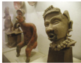
Museo de Arte Americano Maldonado