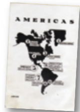
Catálogo Rodolfo Maruca Sosa 1939

En 1939 la Comisión Nacional de Bellas Artes inaugura, en la planta baja del Teatro Solís, la muestra “Reproducciones indo-americanas”, de Rodolfo Maruca Sosa, un autodidacta empleado del Banco Hipotecario. Se trata de más de mil piezas que cubren, por su origen, todo el continente, e incluyen viviendas y fragmentos arquitectónicos en tamaño natural -entre ellos el friso en Tiahuanaco, de la Puerta del Sol, una pieza que hoy integra la colección de Rolf Nussbaum y ha sido exhibida en el MAPI-. Hay entre ellas reproducciones de esculturas precolombinas procedentes de México. Inaugura la muestra el Presidente del Círculo de Bellas Artes, Domingo Bazzurro. La crítica nacional y especialistas del exterior reconocen la validez documental y artística de este trabajo, realizado a partir de libros y documentos estudiados en el Museo de La Plata, en Argentina. La prensa consigna el reclamo de tomar en cuenta este trabajo para el Museo Nacional, inaugurando una sección de Arqueología Americana. El Instituto de Arqueología Americana de la Facultad de Arquitectura, presidido entonces por Armando Acosta y Lara, lo nombra miembro de la sección prehispánica. Las piezas se exhiben nuevamente a fines de 1940, en la Asociación Cristiana de Jóvenes (ACJ). Se trasladan al interior del país acompañadas de conferencias, y algunas de ellas vuelven a la ACJ en ocasión de una “Semana de México”.