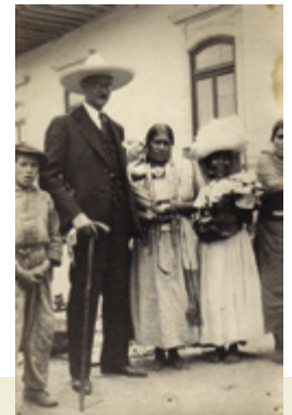
Ángel Falco en México

Falco ingresa a la Academia Militar y sirve como oficial en la guerra civil de 1904. Atraído por el anarquismo, combina su obra como poeta con la acción social. Opta más adelante por la actividad diplomática y representa a Uruguay en Nápoles en 1920, y en México entre 1927 y 1933. Está a cargo del Consulado General del Uruguay hasta 1931, cuando es nombrado encargado de negocios. Forma una colección de arte precolombino de la que se conservan piezas en la Biblioteca Nacional, junto a fotografías y objetos de su estadía en México. En el Archivo Artigas del Ministerio de Relaciones Exteriores de Uruguay existen documentos sobre sus actividades en México, como conferencias acerca de la historia y cultura uruguaya dictadas en 1931 en la Universidad de Guadalajara, y su participación en 1932 en un Festival en Homenaje a Uruguay organizado en Michoacán, dando inicio a una serie dedicada a las repúblicas iberoamericanas. En 1941 publica “Hermano de bronce”, inspirado en el movimiento indigenista mexicano, y en 1964 “La garza blanca de Xicotencatl”.